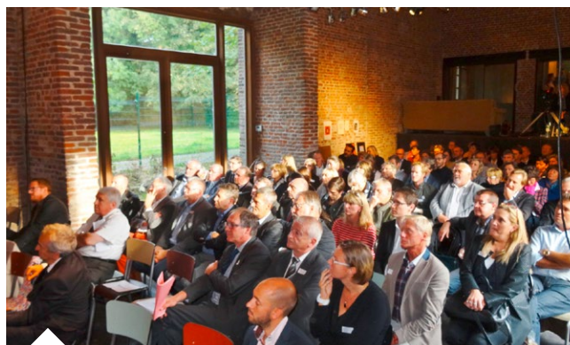
↑ La Petite Fabriek (Froyennes) affichait salle comble pour l'occasion

Initié début 2013, le processus d'actualisation s'est voulu largement participatif. Afin d'impliquer un maximum d'acteurs, différents ateliers thématiques, et plus tard une consultation des porteurs de projets, ont été organisés aux quatre coins du territoire. Bon nombre d'entre eux ont d'ailleurs répondu favorablement à l'invitation du Conseil de développement. Animé par Bruno Coppens, l'événement a ainsi rassemblé plus de 130