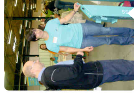
L'organisation du Forum de l'Emploi est tournée. L'édition 2013 est délocalisée en Wallonie picarde

Afin d'écarter la mobilité des travailleurs, les équipes de Pôle Emploi, du VDAB et du Forem travaillent ensemble pour convaincre les gens d'élargir leur horizon de recherche d'emploi par-delà la frontière, qu'elle soit nationale ou linguistique. Véritable temps fort de cette collaboration le Forum de l'Emploi de l'Eurométropole réunit, chaque année, des employeurs qui recrutent, des candidats motivés, des conseils sur l'emploi, la formation ou encore la mobilité. Fort de son succès grandissant (l'édition 2012 a réuni une centaine d'entreprises pour plus de 1000 postes de travail), le Forum de l'Emploi se positionne comme le lieu de rencontre privilégié pour saisir de nouvelles opportunités et nouer des contacts entre tous les partenaires de l'emploi. www.job-eurometropole.com