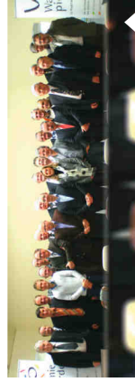
Burhelaat - Décembre 2012

La Conférence des Bourgmestres est un lieu politique informel permettant l'expression des 23 maieurs de la Wallonie picarde. Elle offre, aux dirigeants des communes concernées par le Projet de Territoire, l'occasion de confronter leurs opinions, de débattre des stratégies à adopter et surtout, d'affirmer une volonté et une ambition communes pour notre région. Finances, sécurité, aménagement du territoire, ... la palette des thématiques abordées ne manque pas de variété. Un dénominateur commun guide toutefois les discussions : le citoyen. Car, in fine, qu'il s'agisse de l'organisation des services de secours, de la coopération entre les zones de police ou encore de la détermination des moyens d'habitat, l'objectif reste la meilleure prise en compte des préoccupations citoyennes